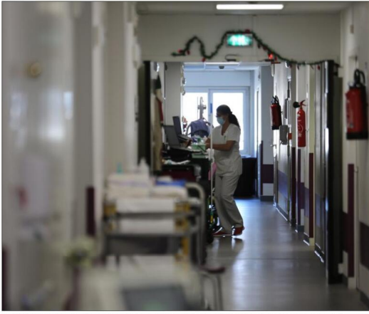
La défiance grandit chaque jour un peu plus entre les dirigeants et syndicats de la clinique et les méthodes du président du groupe Avec.